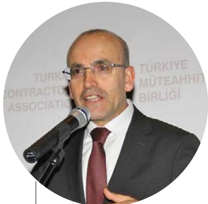
Mehmet Şimşek Başbakan Yardımcısı