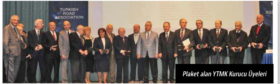
Plaket alan YTMK Kurucu Üyeleri