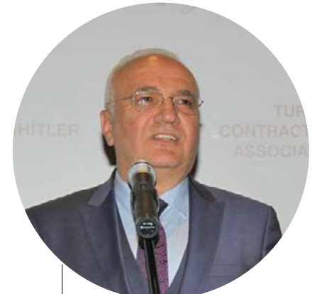
Mustafa Elitaş Ekonomi Bakanı