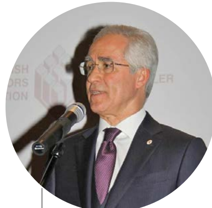
Mithat Yenigün TMB Başkanı